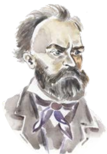
a) Antonín Dvořák

Zakroužkujte významného Čecha, který do této skupinky nepatří, a vysvětlete proč.