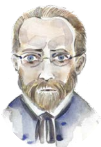
b) Bedřich Smetana