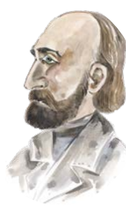
d) Jakub Jan Ryba