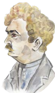
c) Leoš Janáček