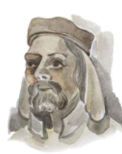
e) Karel IV.