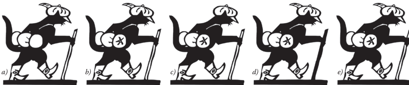
kresba: Josef Lada

Zakroužkujte dva úplně stejné kocoury Mikeše z knihy, kterou nakreslil a napsal Josef Lada.