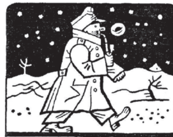
kresba: Josef Lada

Napište, kdo je nakreslený na obrázku Josefa Lada?