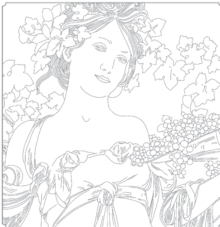
kresba: Alfons Mucha

Vybarvěte černobílou kresbu a dostanete obrázek podle Alfonse Muchy. Podobné motivy jste již možná viděli. Mucha se stal známým po celém světě právě díky svým obrazům krásných žen obklopených květinami a dalšími přírodními motivy.